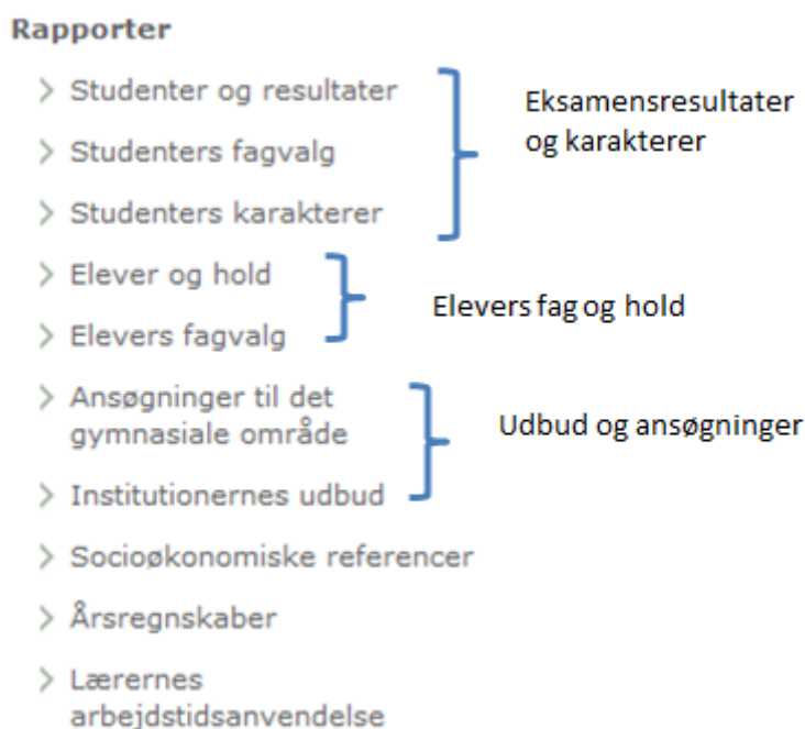
Figur 2. Oversigt over dataområder på uddannelsesstatistik.dk, det gymnasiale område

Adgangen til dataområdet er delt op i flere Excel-ark. Det er gjort for at gøre øge brugervenligheden. Det er fx ikke hensigtsmæssigt, at et ark indeholder en hel række nøgletal, der ikke kan bruges i kombination med en lang række dimensioner. I de tilfælde er data delt op i forskellige ark, hvor nøgletal og dimensioner umiddelbart kan bruges i sammenhæng med hinanden.